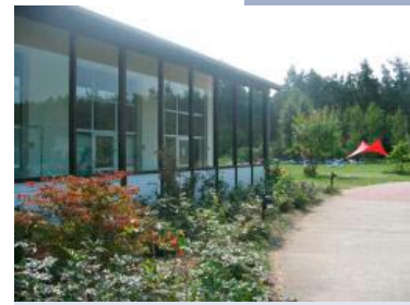
Im Vordergrund sehen Sie unser Bewegungstherapie-Studio, im Hintergrund unsere Liegewiese.

Ihre Bezugstherapeutin koordiniert mit Ihnen gemeinsam Ihren individuellen Wochenplan und stimmt mit Ihnen zusätzliche von Ihnen gewählte Indikationsgruppen ab. Sie können z. B. mehrere Entspannungsverfahren