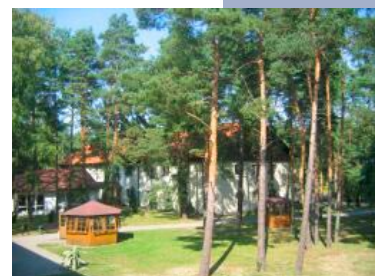
Die Fontane-Klinik lädt Sie ein zur Erholung.

Dies sind einige Beispiele aus Themen, die uns hier bisher anregend