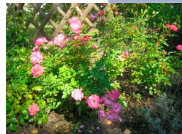
Ein Erfolg unserer projektorientierten Arbeitstherapie in der Gärtnerei.