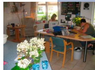
Ein Blick in das Pflegedienstzimmer.